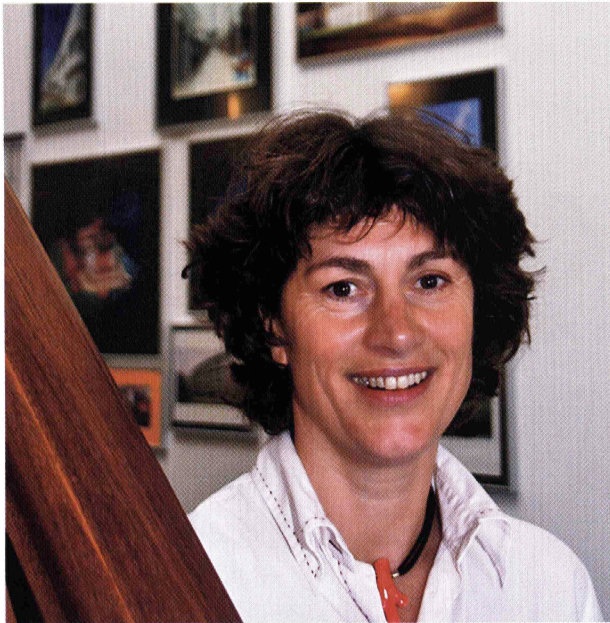
'ALS JE EEN HAGENAAR GEBLINDDOEKT IN EEN HAAGSE STRAAT NEERZET EN JE NEEMT DE BLINDDOEK AF, DAN WEET-IE PRECIËS WAAR HIJ ZICH IN DE STAD BEVINDT'

snappen. Ik vind het belangrijk hoe de woning zich presenteert aan de openbare ruimte. De kap speelt daarin een grote rol. In de Middeleeuwen besteedden de rijken veel geld aan de gevel, dat was hun cadeau aan de stad. Dat is wezenlijk aan het begrip stad: mensen wonen bij elkaar en maken ruimtes. Het maken van een stad komt neer op het beheren van je woonomgeving. Het is mooi als de hand van de metselaar en de timmerman herkenbaar zijn in de gevel. Dat geldt zowel voor restauratie- als voor nieuwbouwprojecten. Wij zijn geen voorstander van projecten die zo glad zijn dat je niet meer kunt zien hoe het gemaakt is. Het dak is volgens mij een van de meest essentiële dingen van een huis of een gebouw. Een kap, een overstek of een gootlijst is belangrijk voor een gevel. Het dak geeft een sterk gevoel van geborgenheid.