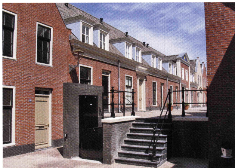
NIEUWEGEIN, VREESWIJK-NOORD. HET BEELD VAN DE STRAATJES SLUIT AAN BIJ DE STERKSTE VOORBEELDEN VAN DE ARGELOZE DORPSE BEBOUWING VAN VREESWIJK. DE TIJDLOZE SCHILDERIJDEN VAN PIETER DE HOÛCH EN JOHANNES VERMEER TONEN GEBRUIKSMOGELIJKHEDEN VAN EEN WOONVERTREK-STOEP-AUTOVRIJE STRAAT. LANGS- EN DWARSKAPPEN VERLEVENDIGEN HET STRAATBEELD.