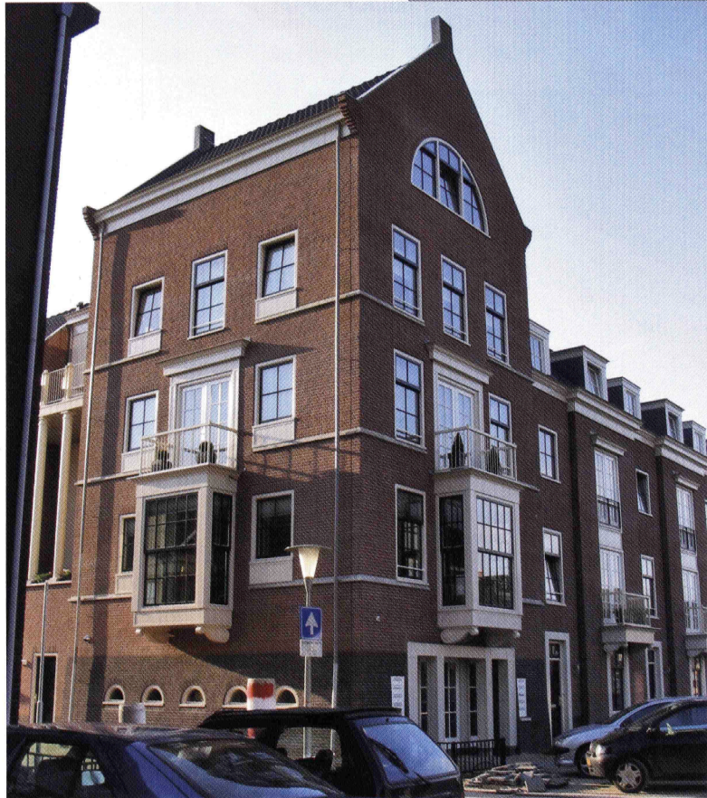
SCHUYTGRAAF, ARNHEM. DOOR EEN ASYMMETRISCHE OPLOSSING MET AANGEPASTE WONINGTYPEN IS EEN SMALLE EN INFORMELE ENTREE NAAR DE PARKEERKOFFER ONTWORPEN. DE BEBOUWING AAN HET PLEIN BESTAAT UIT GESTAPELDE APPARTEMENTEN.

'Een steeg, een straat, een plein kun je als bewoner begrijpen. Een parkeerdek of een sneltram is voor een bewoner niet te